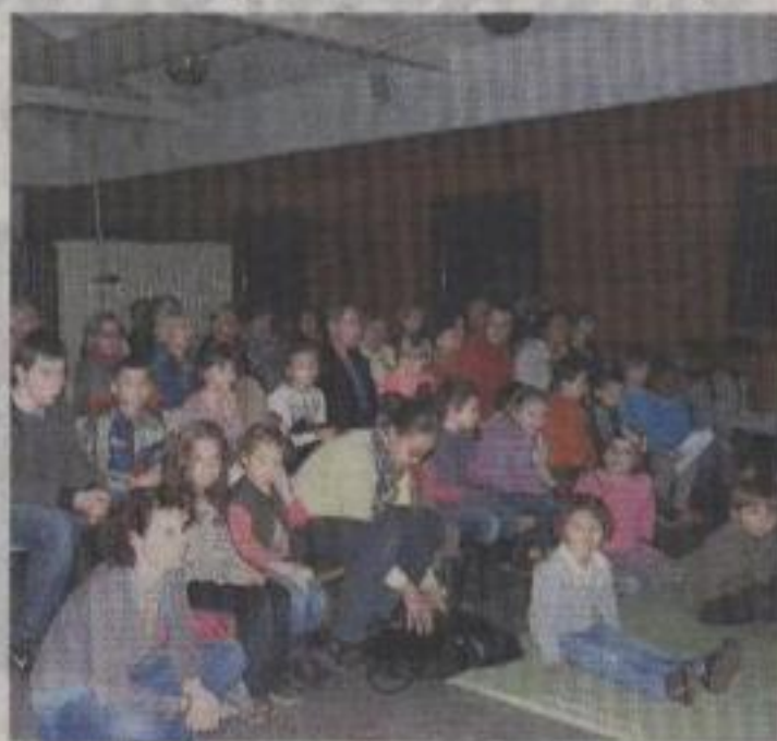
■ Des spectateurs très à l'écoute.